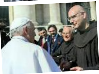
Piazza S. Pietro - Il Santo Padre con la delegazione di Bisignano che accompagna la statua del santo.

Papa Francesco benedice una nuova statua di Sant'Umile che sarà collocata sulla collina andistante il Santuario di Bisignano